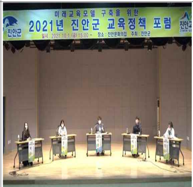
교육정책 포럼 개최(10.1.)