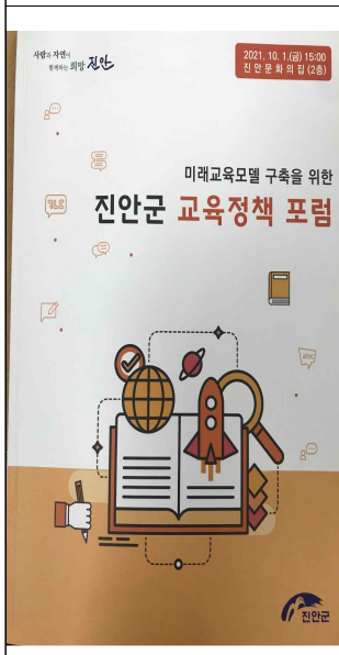
포럼 및 진안군 자녀지원사업 안내 책자 제작